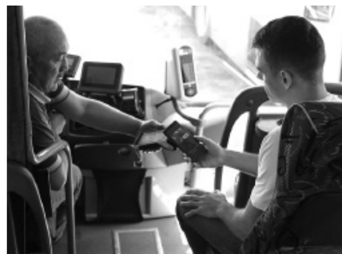
Платить проезд смартфоном и удобно, и выгодно

5 рублей скидки с каждой поездки при оплате проезда картой «Мир» с телефона до 30 сентября 2024 года.