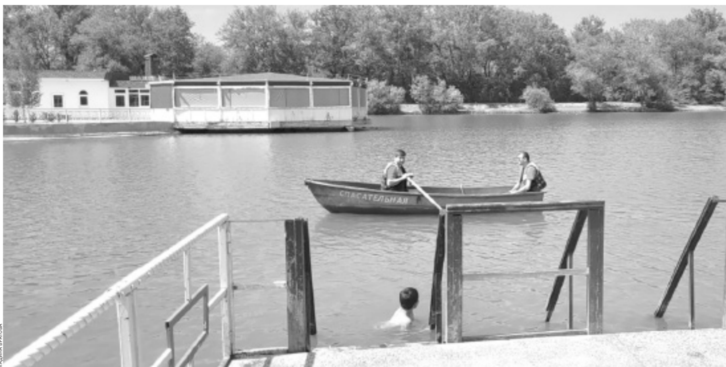
Сотрудники центра ГИМС МЧС России по КЧР на посту

В Черкесске, в парке культуры и отдыха «Зелёный остров», у водоемов, где организован пляж, постоянно проводят рейды сотрудники центра Государственной инспекции по маломерным судам МЧС России по КЧР. Наблюдения ведутся как с берега, так и на самой воде. В случае обнаружения нарушения правил поведения спасатели проводят беседы с гражданами